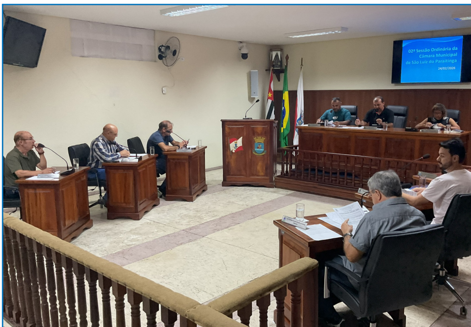
2ª Sessão Ordinária de 2026, 24 de fevereiro.

CÂMARA MUNICIPAL, PODER ORIGINÁRIO QUE EXERCE COM A PREFEITURA DE FORMA HARMÔNICA E INDEPENDENTE, O GOVERNO DO MUNICÍPIO