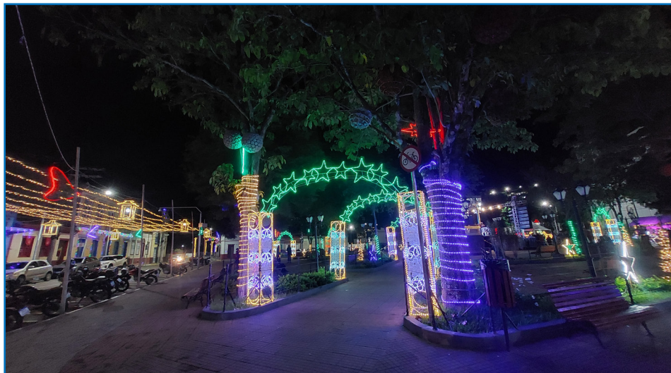
A Praça Oswaldo Cruz está mais decorada que nunca para o Natal 2025.

O Concurso Municipal de Decoração Natalina denominado “Natal Iluminado” tem como finalidade incentivar moradores e estabelecimentos a decorarem seus imóveis durante o período das festividades de Natal e Ano Novo, de forma a promover o embelezamento da cidade; fortalecer o espírito natalino e a convivência comunitária;