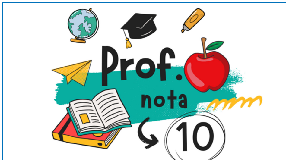
Professores agora poderão ser agraciados com o Prêmio Professor Nota 10.

O projeto de lei tem por finalidade reconhecer, valorizar e divulgar práticas pedagógicas inovadoras e relevantes desenvolvidas por professores da Rede Municipal de Ensino. O Prêmio “Professor Nota 10” será concedido anualmente, durante o mês de outubro, com a finalidade de incentivar a melhoria da qualidade do ensino e destacar o mérito profissional dos docentes. Poderão concorrer ao prêmio todos os profes-