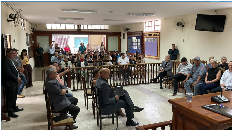
Sessão Solene de entrega dos Títulos de Cidadão Luizense.

No dia 15 de novembro, às 10h, a Câmara Municipal de São Luiz do Paraitinga realizou a 5ª Sessão Solene de 2025, feita com o intuito da entrega de 12 Títulos de Cidadão Luizense. A celebração aconteceu com a presença de diversa autoridades locais e da