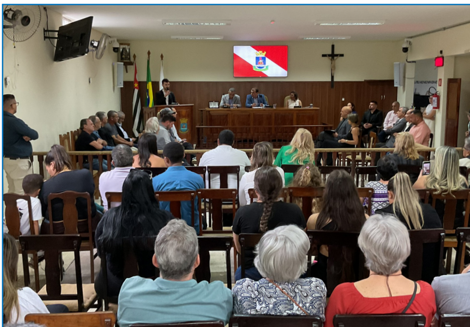
05ª Sessão Solene de 2025.

CÂMARA MUNICIPAL, PODER ORIGINÁRIO QUE EXERCE COM A PREFEITURA DE FORMA HARMÔNICA E INDEPENDENTE, O GOVERNO DO MUNICÍPIO