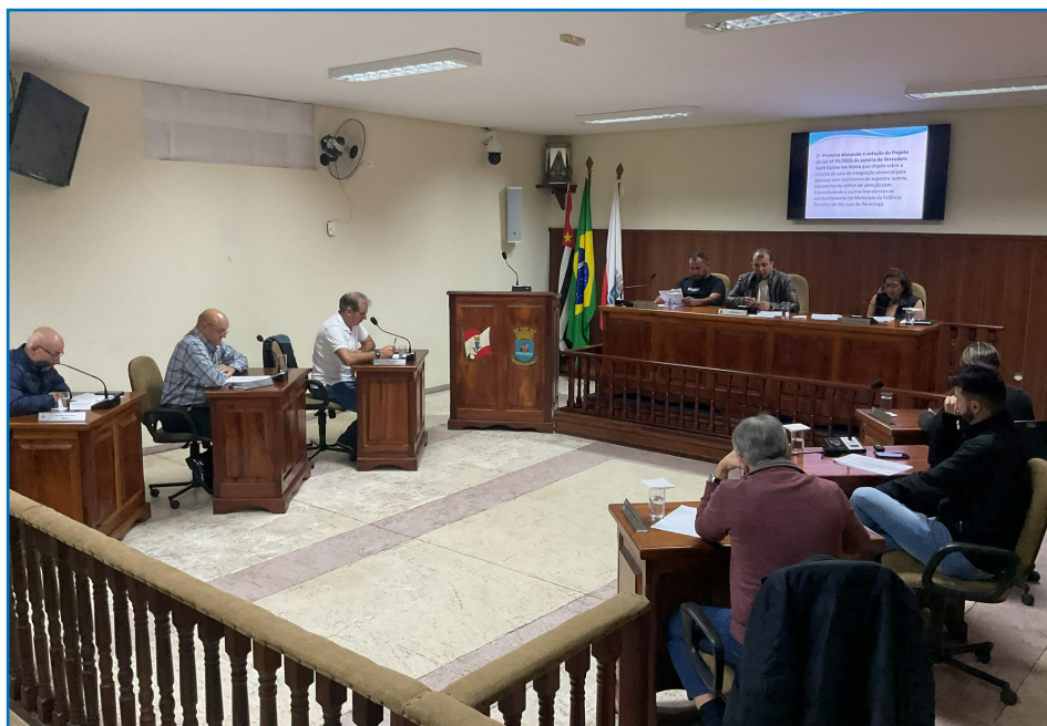
12ª Sessão Ordinária de 2025 - 22/07/2025.

CÂMARA MUNICIPAL, PODER ORIGINÁRIO QUE EXERCE COM A PREFEITURA DE FORMA HARMÔNICA E INDEPENDENTE, O GOVERNO DO MUNICÍPIO