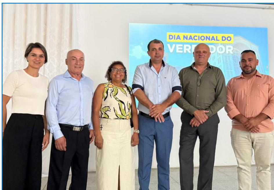
Vereadores participam de celebração em Aparecida do Norte/SP.

CÂMARA MUNICIPAL, PODER ORIGINÁRIO QUE EXERCE COM A PREFEITURA DE FORMA HARMÔNICA E INDEPENDENTE, O GOVERNO DO MUNICÍPIO