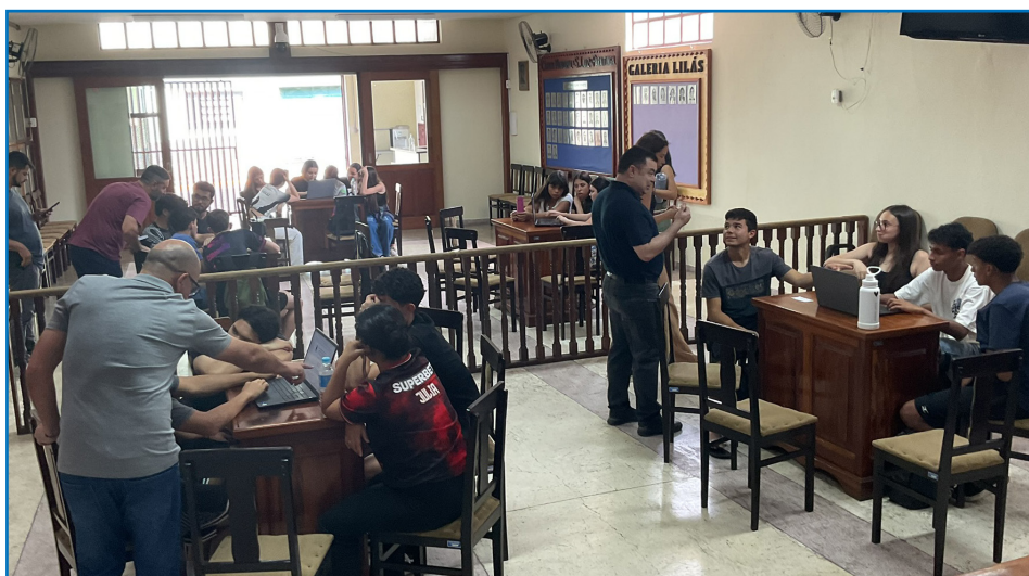
A dinâmica em grupos fortaleceu o debate e demonstrou a argumentação dos alunos.

Em outubro mais uma vez teve espaço a parceria da Câmara Municipal de São Luiz do Paraitinga com a Escola Estadual Monsenhor Ignácio Gióia, através das matérias eletivas